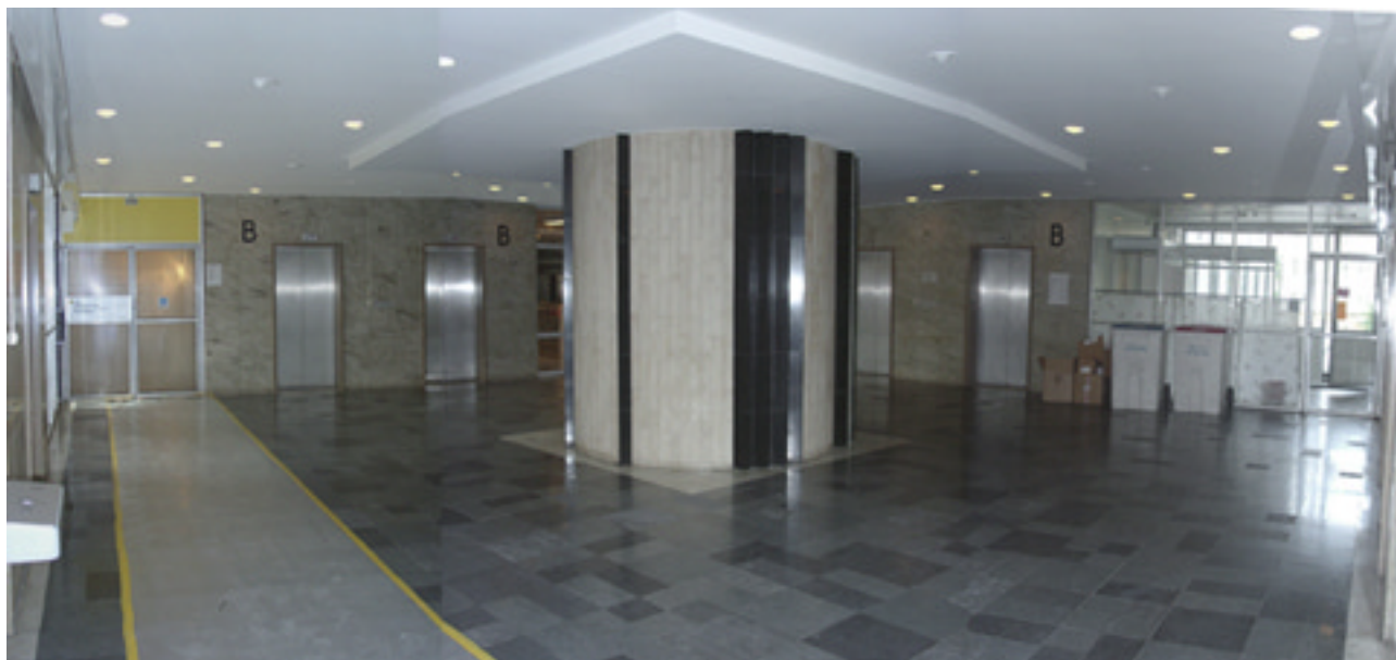
Dagens hisshall vån. 1 tr. med vitmålat tak. Golvet är skyddat p.g.av arbete med nya installationer.

Hisshallen vån. 1tr. stod ursprungligen i öppet samband med entréhallen och Allmänhetens hall och ingår i den grupp av centrala utrymmen som är omistliga för husets karaktär.