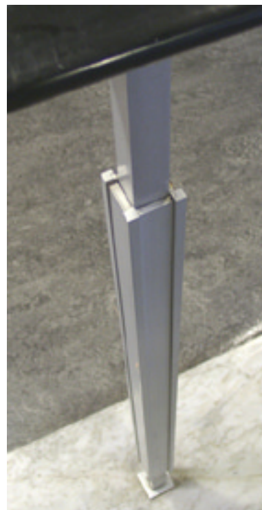
Detalj av räckesständer i aluminium.