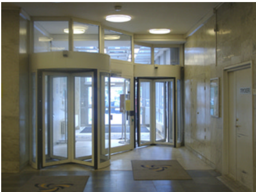
Karusell dörrar från 90-talet vid huvudentrén.

Vindfånget bestod ursprungligen av två glaspartier med vardera två par utåtgående slagdörrar. Det har sedan byggts om i etapper och är idag totalt förändrat.