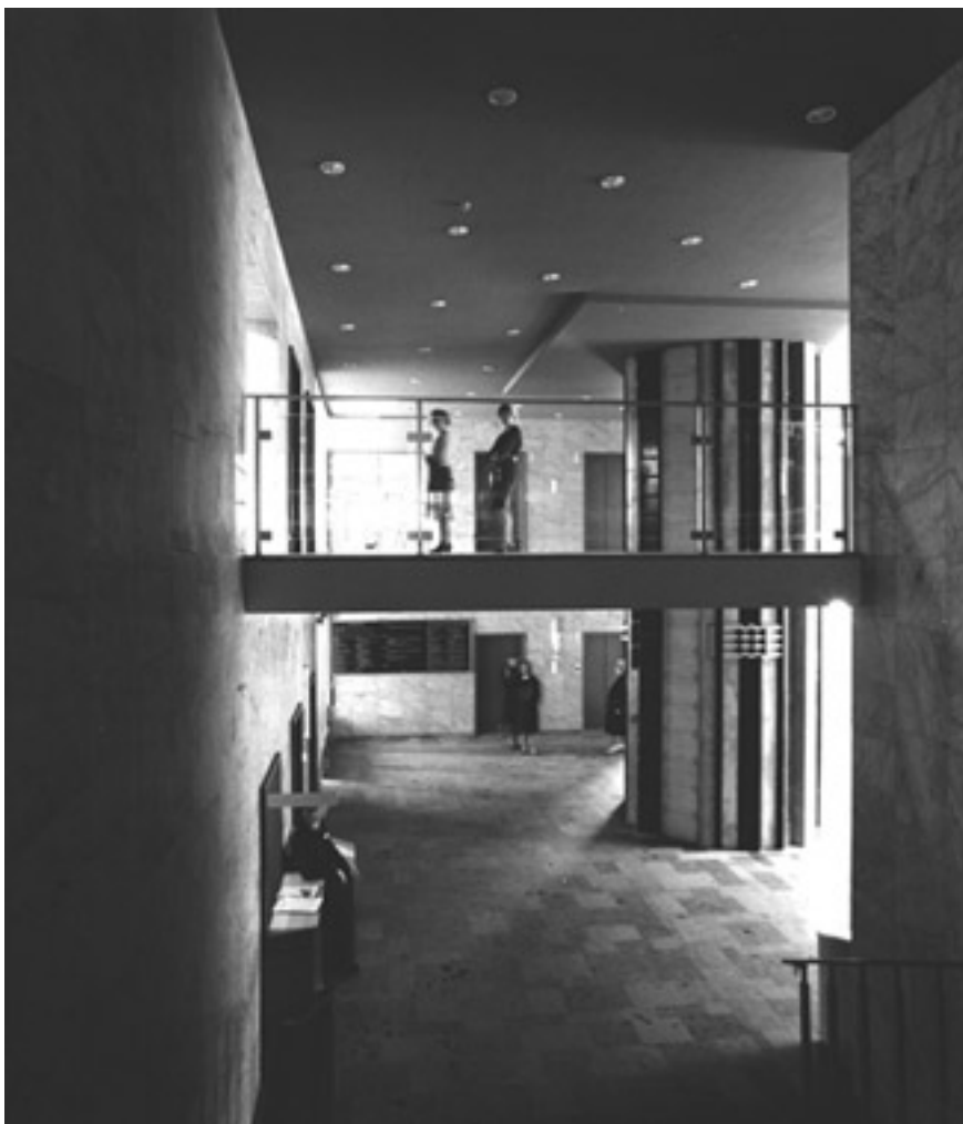
Entréhallen och hisshallen vän. 1tr. kring 1960. Bilden tagen från trappan till Allmänhetens hall.

Rummet får ljus från de två trapphusen och från vindfånget. Däremot saknades ursprungligen på entréplanet kontakten med höghusets två fria flyglar, de hyrdes ut som kommersiella lokaler. Idag är det inte längre så och nya glas/stålpardier har tillkommit.