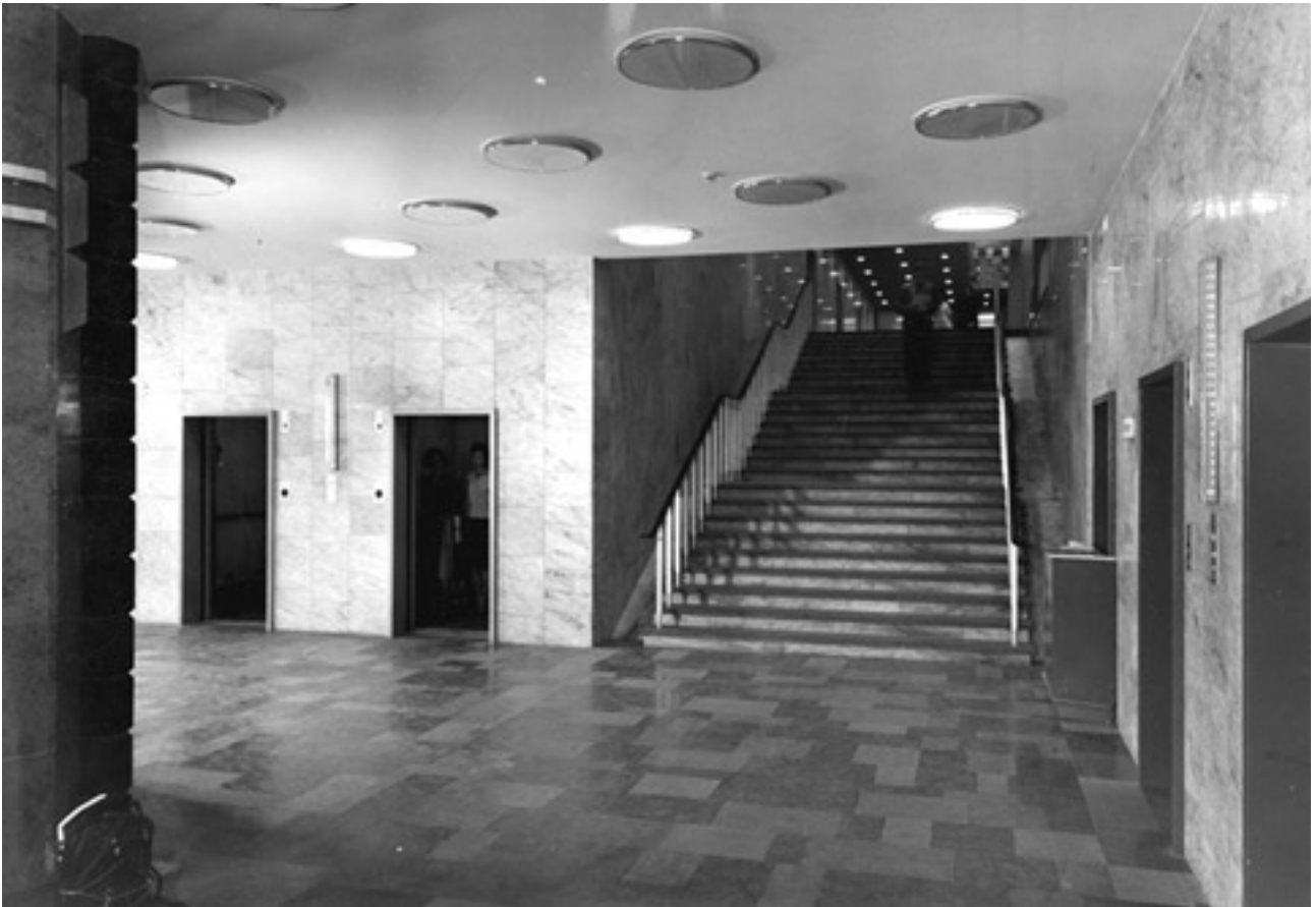
Entréhallen i början av 60-talet. I fonden trappan upp till Allmänhetens hall.

Entréhallen är det rum en besökare till huset först möter. Den ingår i den grupp av centrala utrymmen som är omistliga för husets karaktär.