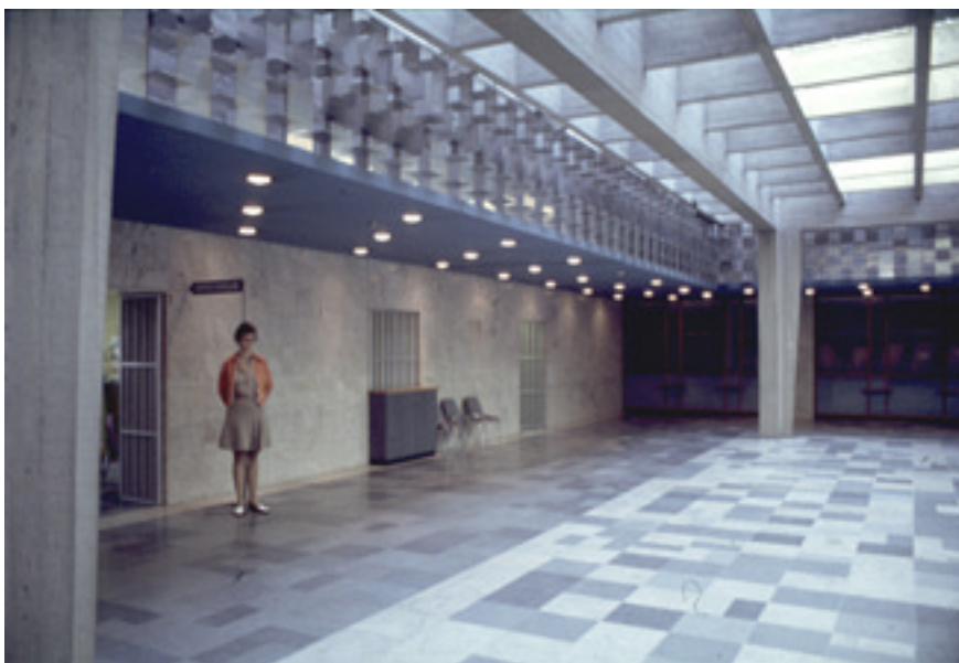
Allmänhetens hall på 60-talet, med Lars Rolfs grindar i muröppningarna. Disken i den mittersta öppningen ingick inte i den ursprungliga inredningen. Bild från Paul Hedqvist arkitektkontor.

Allmänhetens hall är det mest genomarbetade och påkostade rummet i huset och ingår i den grupp av centrala utrymmen som är omistliga för husets karaktär. Rummet präglas av en stor taklanternin av betong, utformad som ett kassettak med kvadratiska ljusöppningar täckta av plastdomer. Lanterninen bärs upp av fyra korsformade betongpelare. Det en gång flödande dagsljuset har idag problem att nå in p.g.a. slitna och gulnade plastdomer samt ett nytt under lanterninen sittande trådglaskikt som omöjliggör rengöring av lanterninens inre.