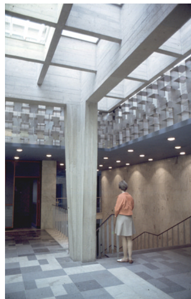
Interiör från 1960-talet med trappan ner mot entréhallen. Hela den bärande konstruktionen är utförd i högklassigt gjuten betong.

- Igensatta, ursprungliga öppningar i den marmorkädda väggen bör upptas och förses med metallgrindar i originalutförande.