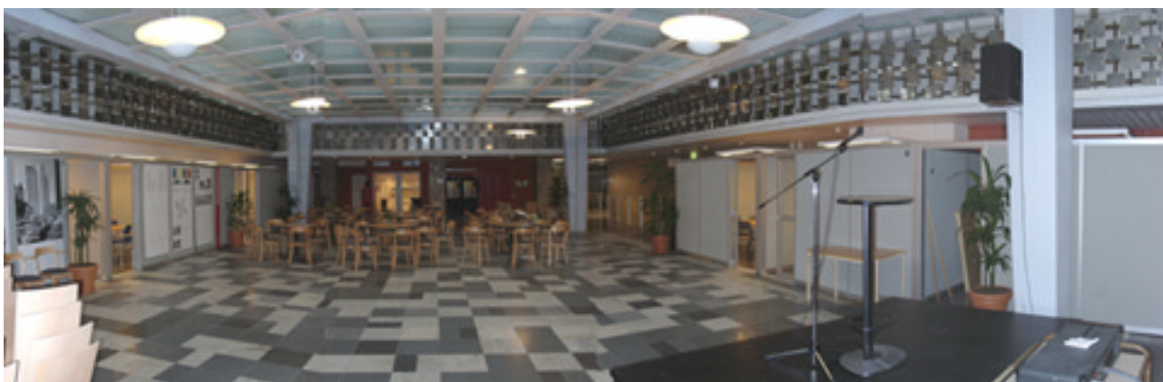
Allmänhetens hall idag. Bilden är ett montage av fyra foton.

Golv och väggar är klädda med sten i säregna mönster. Utmed rummets väggar löper en omgång med lägre höjd där taket ursprungligen var blåmålat med infällda armaturer, som en stjärnhimmel.