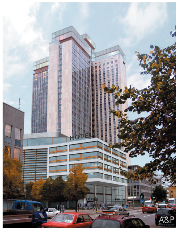
Fotomontage: Ahrbom & Partner

2003 sålde Vasakronan höghusfastigheten till Stockholms stad för omvandling till studentbostäder.