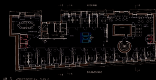
Alt. 3. MÖBLINGSPLAN, PLAN 0